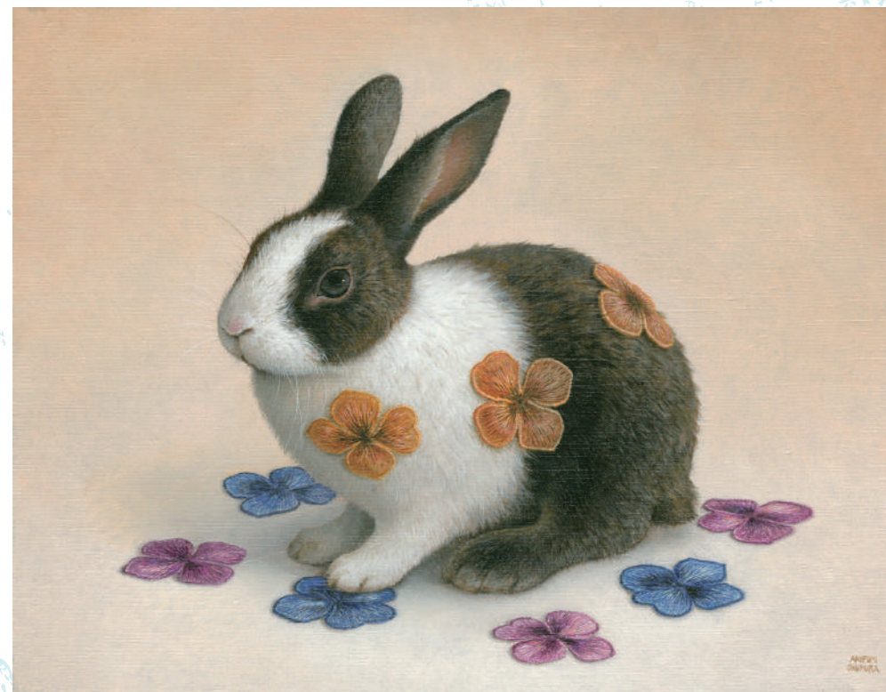
06 花うさぎ 6号 / 油彩