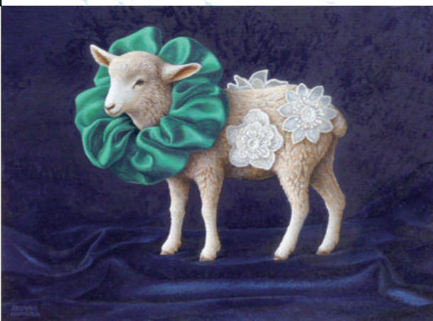
09 Like a Lion 4号 / 油彩