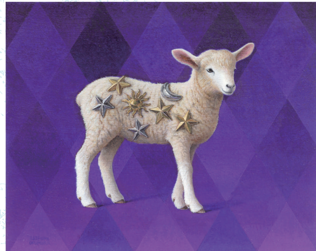
12 スターリーシーフ 3号 / 油彩