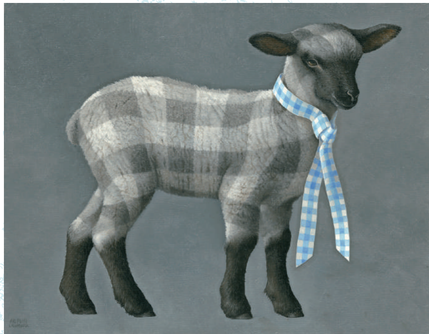
Check on Check 05 6号 / 油彩