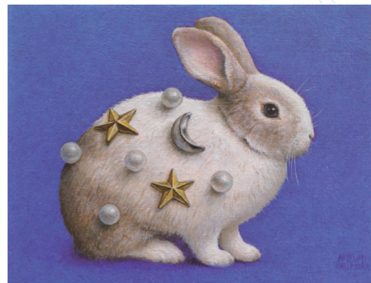
13 スターリーラビット 0号 / 油彩