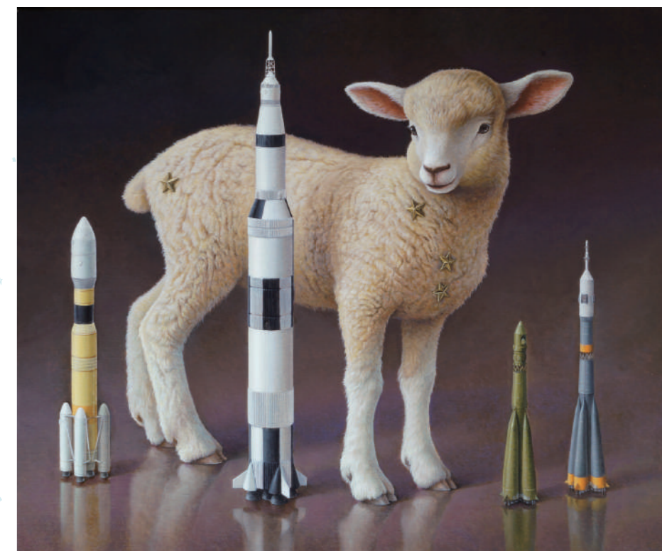
02 アリエス 20号 / 油彩