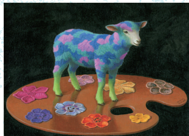
カレイドシーフ 08 4号 / 油彩